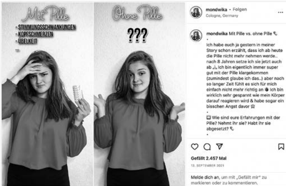
Abbildung 2: Instagram-Post einer Influencerin zum Absetzen der Pille

(53 %) enthalten Erfahrungsberichte, oft mit Fokus auf unerwünschte Nebenwirkungen der Pille. So liest man zum Beitrag von »mondwika« (Abbildung 2) Kommentare wie »Habe die Pille vor Jahren abgesetzt, mir geht es so tausendmal besser«.